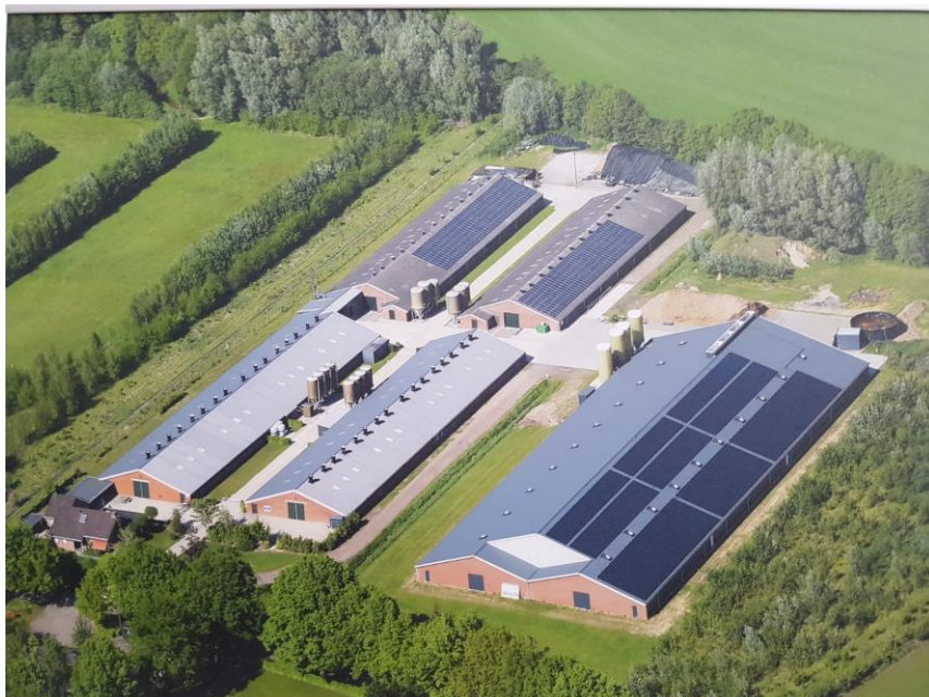
Dak Schieven/Grefte Grobbenweg Zieuent, project 1: start productie 4-7-16