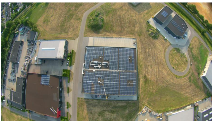
Dak Wopa Constructie Koningslinde Lichtenvoorde, project 2: start productie 1-7-2018